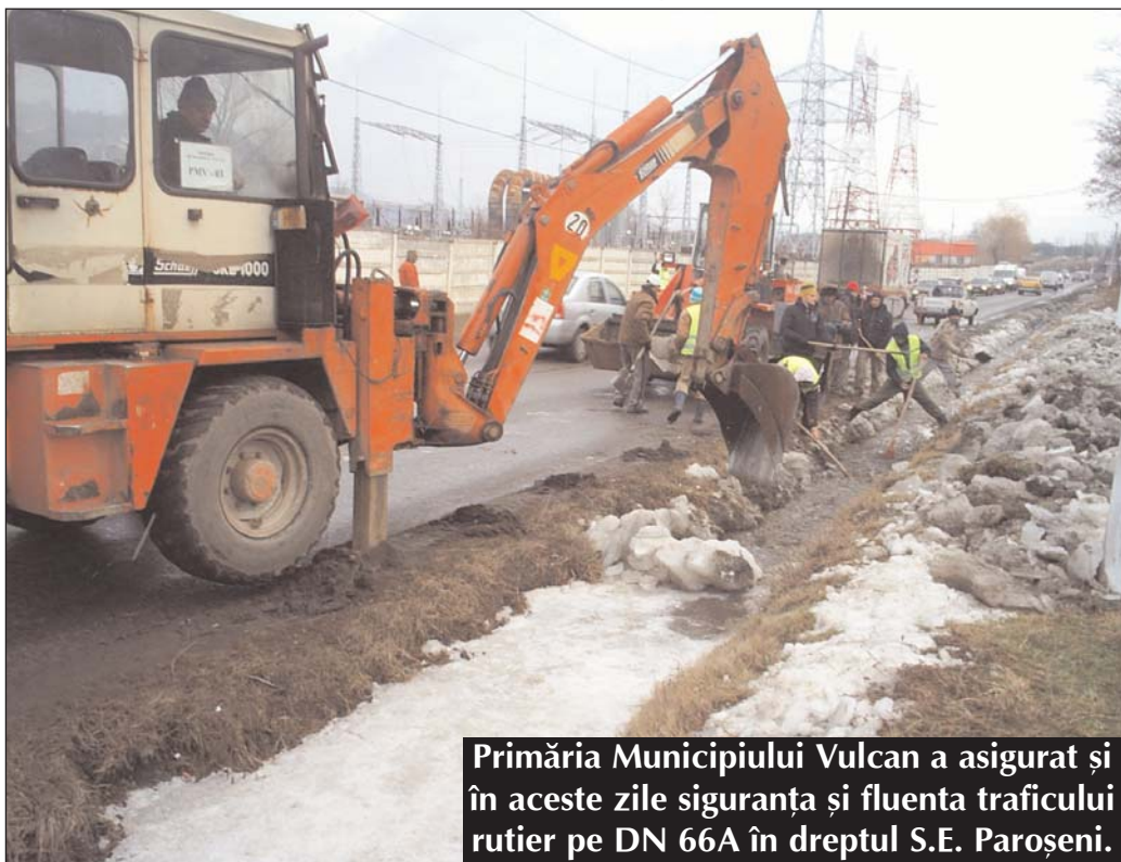
Primăria Municipiului Vulcan a asigurat și în aceste zile siguranța și fluenta traficului rutier pe DN 66A în dreptul S.E. Paroșeni.