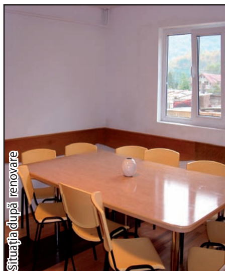
Situația după renovare