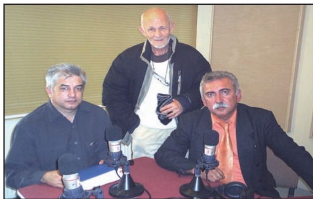
În studioul Radioului Național într-o emisiune despre ISTORIA PRESEI ȘI LITERATURII HUNEDORENE de la începuturi până în prezent.