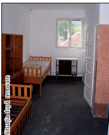
Situația după renovare