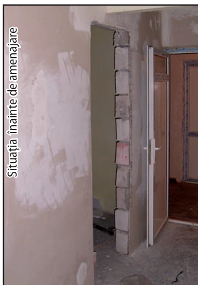
Situația înainte de amenajare