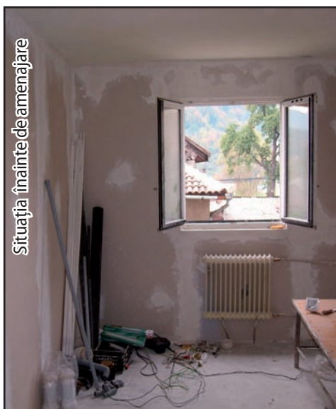
Situația înainte de amenajare