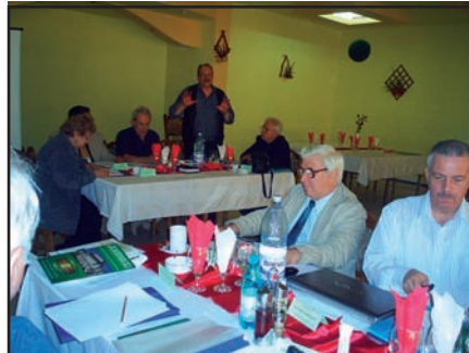
Completarea statutului a fost unul dintre punctele principale ale Conferinței