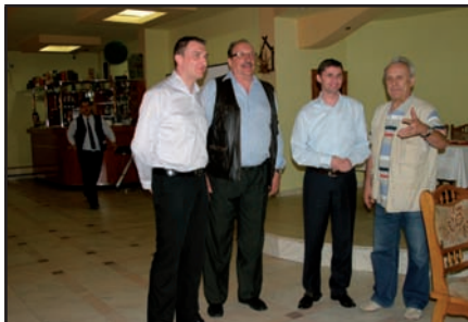
Gazdele adresează salutul de "Noroc Bun"