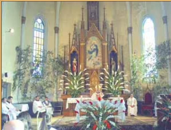
Comunitatea romano-catolică din Vulcan a sărbătorit un secol de existență a bisericii din localitate